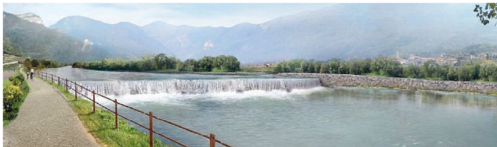
Il rendering della diga: l'acqua in sfioramento coprirebbe stabilmente alla vista i 5 metri di piloni e sbarramento

Una briglia alta cinque metri tra Pomarolo e Volano In sponda sinistra, un canale navigabile lungo 200 metri