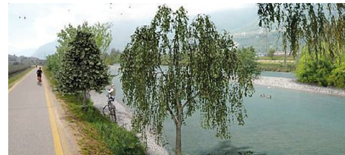
Il canale artificiale previsto in sponda sinistra per il passaggio dei pesci

ese e Volano. Avrà cinque luci, sarà alta cinque metri con quattro piloni di un metro e mezzo, sempre sommersi dall'acqua. Ci sarà un canale di derivazione, interrato, sul lato di Pomarolo, mentre su quello di Volano si prevede un altro canale all'aperto, di by-pass per i pesci, il quale, si evidenzia nel progetto, potrebbe diventare navigabile per le canoe o altri mezzi. Lungo 200 metri, occuperebbe i prati a fianco della ciclabile. La centrale idroelettrica si troverà a Pomarolo, in gran parte sotto